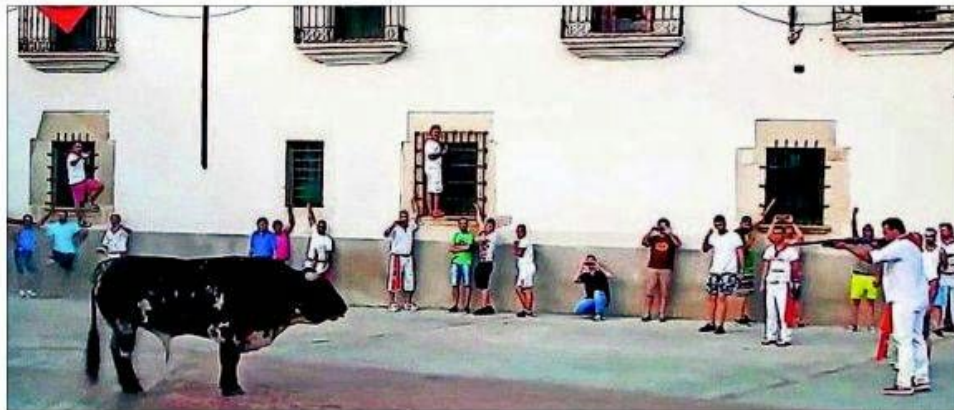
VOX ÁNIMA (YOUTUBE)